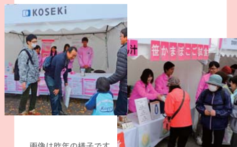
画像は昨年の様子です