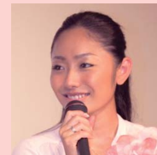
フィギュアスケーター 安藤 美姫 さん

イベントは13:00過ぎから予定しておりますが、スケジュールは変更になる場合がございます。