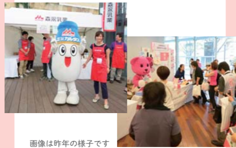
画像は昨年の様子です